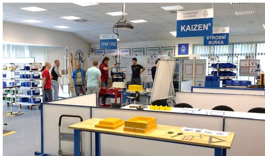
Rychlá změna (postup)